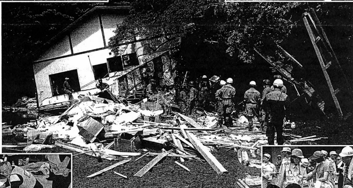
平成20年(2008年)岩手・宮城内陸地震

Copyright (C) INSTITUTE FOR FIRE SAFETY & DISASTER PREPAREDNESS