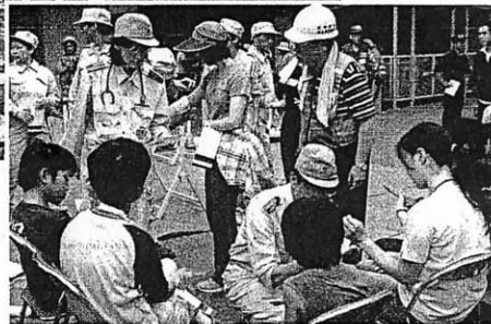
武蔵野市内防災訓練時の協働