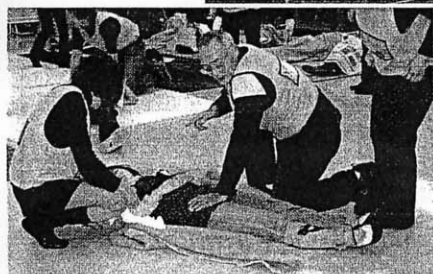
演習「住民でもできるトリアージ」